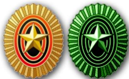
Кокарды на головной убор