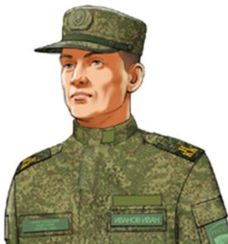
Варианты ношения полевой формы одежды