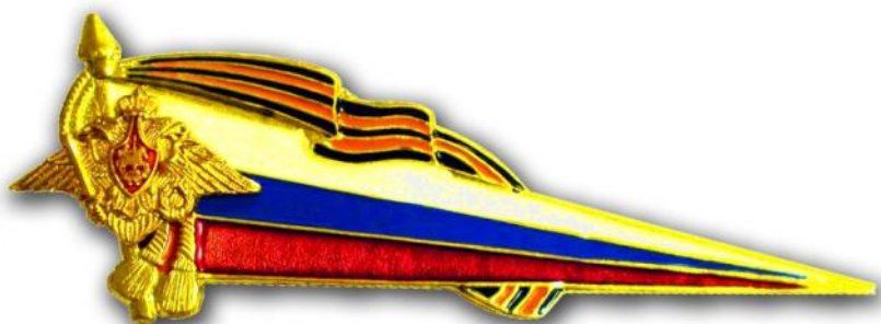
Флажок на берет