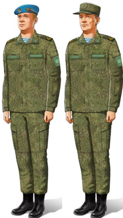
летняя в ботинках с высокими берцами