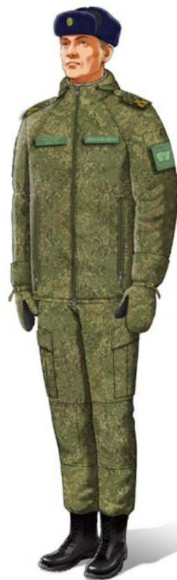
зимняя в ботинках с высокими берцами