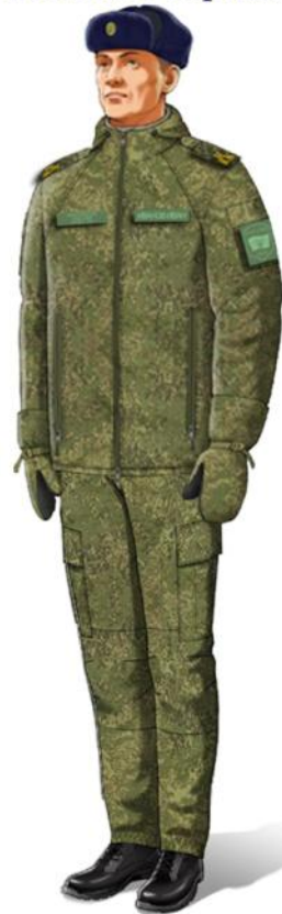
зимняя в полуботинках